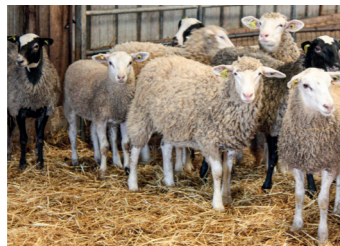
Coralie Chaumeny Animatrice section ovine

La coprologie permet d'avoir une idée du niveau d'infestation parasitaire et du type de parasite présent dans votre lot. C'est un outil d'aide à la décision qui permet, en fonction des résultats, d'adapter au mieux la prévention et les traitements.