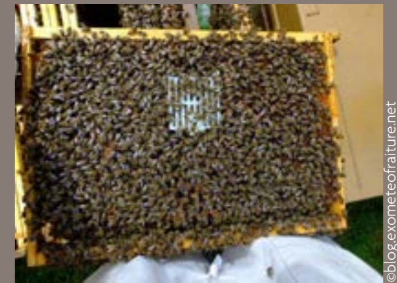
Photo 1 - Cagette dans un cadre de couvain.

En l'absence de couvain, la population de varroas ne peut pas se développer et les individus sont alors tous en phase de phorésie* . Ils sont alors accessibles et vulnérables aux acaricides. Pour ces raisons, la recherche de période sans couvain est intéressante afin d'optimiser l'efficacité d'un traitement médicamenteux (par exemple, l'Api Bioxal®, à base d'acide oxalique, n'est pas actif sur les parasites présents dans les alvéoles).